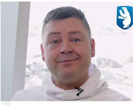
Nunanut Allanut, Inuussutissarsiornermut, Niuernermut Silallu Pissusianut Naalakkersuisoq, Pele Broberg, maaji 2021-mi aallartitanut immiut ilisaritippoq.

Maaji 2021-mi ukioq taanna aprilimi Inatsisartunut qinersineq pillugu Sinniisoqarfimmi pisortap aallartitat 40-t sinneqartut ilisimatitsissuteqarfigai. Ilisimatitsineq qineqqusaarutaasut, qinersinerup inernera aamma Naalakkersuisoqatigiinnut nutaanut tunngavoq. Nunanut Allanut, Inuussutissarsiornermut, Niuernermut Silallu Pissusianut Naalakkersuisoq, Pele Broberg, ilisimatitsineq sioqqullugu video atorlugu inuulluaqqussuteqarpoq, taannalu ingerlateqqinneqarpoq.