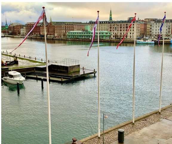
Kòbenhavnimi Kalaallit Nunaata Sinniisoqarfia, Savalimmiut Sinniisoqarfia aamma Islands Ambassade peqatigalugit Nordatlantens Bryggemi inissisimapput. Nordatlantens Brygge Kalaallit Nunaannit, Islandimit, Savalimmiunit Danmarkimillu ataatsimut pigineqarpoq.

Kalaallit Sinniisoqarfiat 2020-mi Sinniisoqarfimmi suleriaqqinnissamut periusissamik akuersipput. Periusissiami ilaatigut allaqqavoq Kòbenhavnimi Kalaallit Sinniisoqarfiat suliassaqarfinni assigiinngitsutigut Kalaallit Nunaannik sullissivoq namminersulivinnissamut aamma aningaasarsiornikkut inerisaanerunermut pitsannorsaataasussanik.