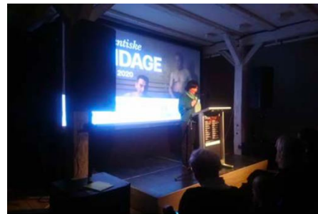
Marsi 2020-mi Atlantikup Avannaamiunut filminut ulloqartitsinermi filmip "The Last Ice Hunters"-ip takutinneqannginnerani Sinniisoqarfimmi pisortaq oqalugiarpoq.

Sloveniamiut aallartitaat suleqatigalugu Sinniisoqarfimmi Nordatlantens Bryggemi marsi 2020-mi Atlantikup Avannaamiut filminik festivaleqarneranni filmi piviusulersaarut "The Last Ice Hunters" takutinneqarpoq. Festivalimi tassani filmip piviusulersaarutip "Håbets Ø"-p ilassutaatut Sinniisoqarfik oqallinnermut peqataavoq.