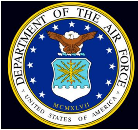
US Department of the Air Force

Novembari 2020-mi Sinniisoqarfimmi pisortaq Naalakkersuisut Siulittaasuata Naalakkersuisoqarfianit sinniisoq peqatigalugu suliffeqarfiit suliffeqalernissamut sungiusarfiusut pillugit nunap immikkoortuinik Arubamik aamma Mayottemik video atorlugu ataatsimiinnermi peqataavoq.