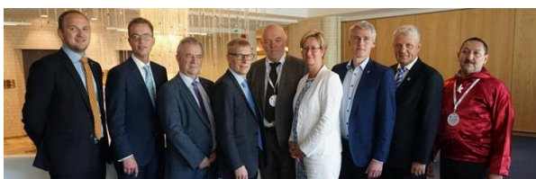
De Nordiske Fødevarer-, Landbrugs- og Fiskeriministre i Turku 29. juni 2017.

Naalakkersuisoq foreslog endvidere, at innovation i forhold til bedre udnyttelse af marine ressourcer bør være et af panelets prioriteringer. Ved at det nordiske bioøkonomi panel fremhæver potentialet i den blå bioøkonomi, kan Norden påvirke, at verdens have, globalt ses som en kilde til bedre fødevarer sikkerhed.