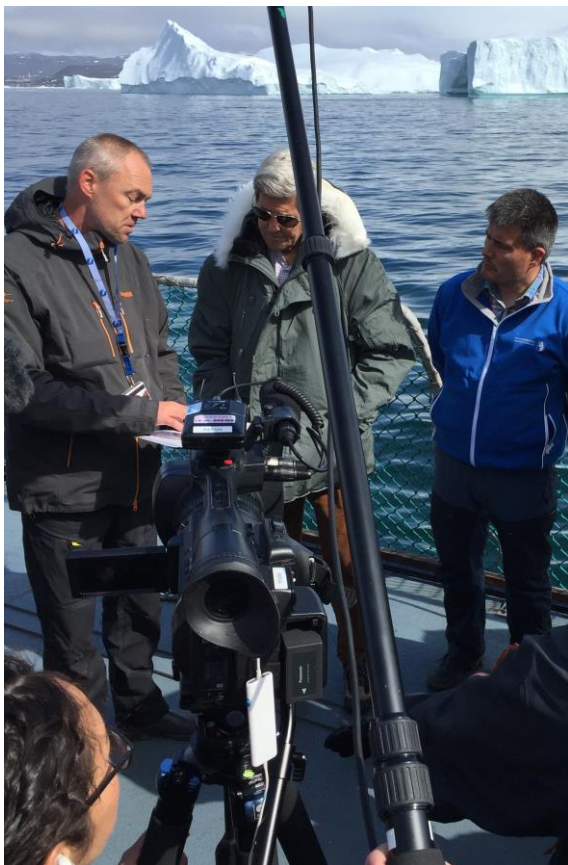
Formanden for Naalakkersuisut Kim Kielsen med USA's forhenværende udenrigsminister John Kerry d. 17. juni 2016

I det forløbne år, har Udenrigsdirektoratet været placeret under Naalakkersuisoq for Erhverv, Arbejdsmarked, Handel, Energi og Udenrigsanlig-