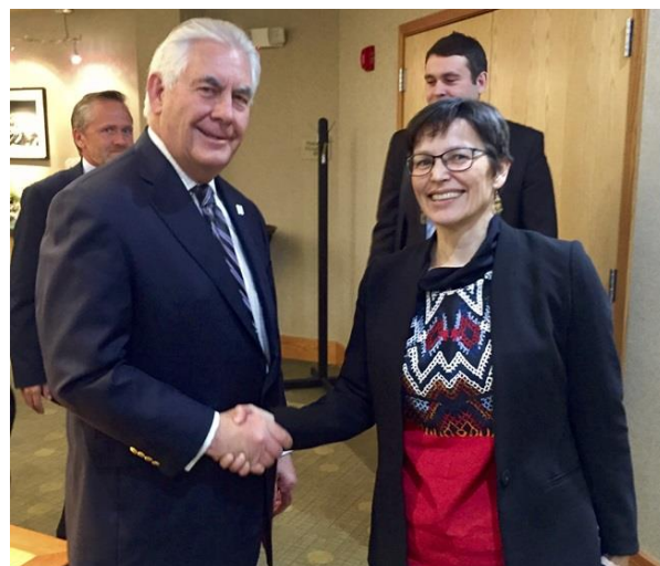
Naalakkersuisoq for Selvstændighed, Udenrigsanliggender og Landbrug Suka K. Frederiksen sammen med USA's Udenrigsminister Rex Tillerson.

I forlængelse af ministermødet mødtes Naalakkersuisoq Suka K. Frederiksen, sammen med den danske udenrigsminister, Canadas udenrigsminister Chrystia Freeland og USA's udenrigsminister Rex Tillerson, hvor forskellige emner som grænsedragninger, kontinentalsokkel og Thule Air Base blev berørt. Naalakkersuisoq understregede bl.a., at en vigtig del af forsvarsaftalekomplekset mellem Grønland og USA er, at sikre Grønland og det grønlandske samfund det mest mulige afkast og fordele af den amerikanske militære tilstedeværelse.