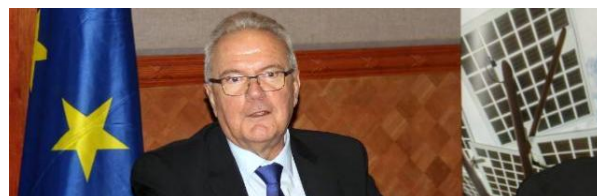
Europa Kommissær Neven Mimica besøgte Nuuk og Ilulissat den 1.-2. juni 2017.

For at fastholde interessen for Grønland i EU-systemet og blandt EU's medlemslande, arbejder Repræsentationen i Bruxelles for at sikre besøg på højt niveau til Grønland. Kommissær for Internationalt samarbejde og Udvikling, Neven Mimica, besøgte Grønland den. 1-2 juni 2017.