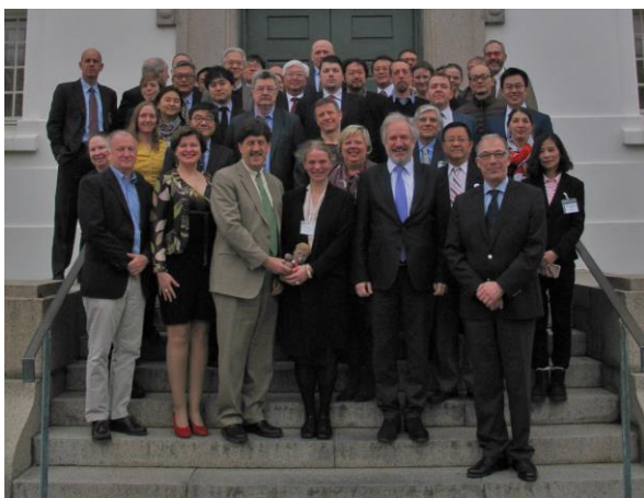
Delegationer til forhandlinger om fiskeriaftale i den arktiske højsø, Reykjavik 18. marts, 2017.

Grønland er forhandlingsleder for Kongerigets delegation, ved Departementet for Fiskeri og Fangst. Kongerigets delegation omfatter herudover ICC Grønland, en repræsentant fra det danske Udenrigsministerium samt repræsentanter for Landsstyret på Færøerne.