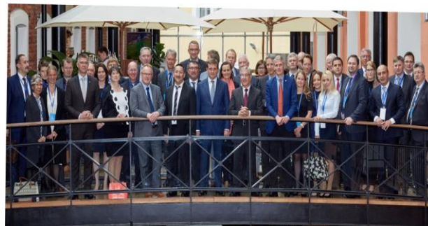
De nordatlantiske fiskeriministre og delegationer, Skt. Petersborg 8. juni 2016.

Canada er vært for NAFMC 28. – 30. august 2017, som afholdes i Shediac, New Brunswick.