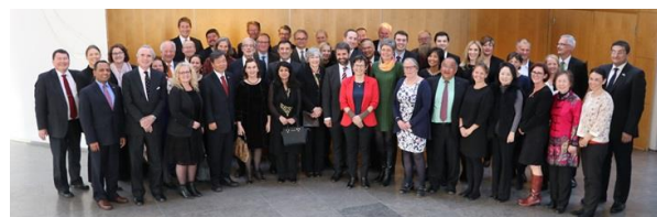
Ambassadørerne mødte en lang række vigtige grønlandske aktører da Naalakkersuisoq for Selvstændighed, Udenrigsanliggender og Landbrug tirsdag den 30. maj var vært for en middag på vegne af Naalakkersuisut.

Den 30. maj – 02. juni afholdte de udenlandske ambassadører i Danmark deres årlige ambassadørmøde, denne gang i Grønland. Ambassadørerne var således i Nuuk og Ilulissat, hvor bl.a. medlemmer af Naalakkersuisut præsenterede Grønlands nuværende situation og udviklingsmuligheder- og udfordringer, og hvorledes samarbejdet med de danske ambassader kan styrkes yderligere.