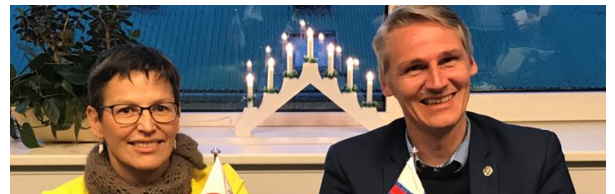
Naalakkersuisoq for Selvstændighed, Suka K. Frederiksen med den færøske selvstændighedsforkæmper fiskeriminister Høgni Hoydal.

Grønland og Færøerne har meget tilfælles og stor gavn og glæde af hinanden. De to lande er stærke sammen og har mange områder, hvor landene kan hjælpe hinanden. Vi lever af og med naturen.