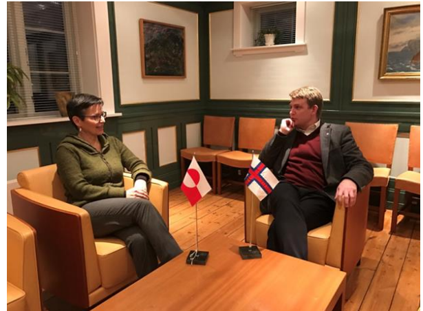
Naalakkersuisoq for Selvstændighed, Udenrigsankliggender og Landbrug Suka K. Frederiksen med den færøske lagmand Aksel V. Johannesen

Der blev også tid til et møde med den færøske indenrigs- og sundhedsminister Sirið Stenberg.