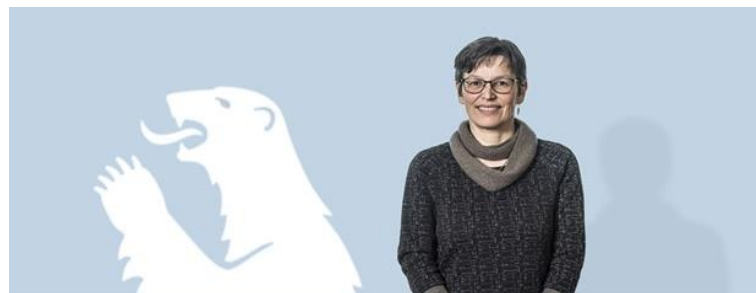
Naalakkersuisoq for Selvtændighed, Udenrigs- liggender og Landbrug Suka K. Frederiksen

Grønlands udenrigstjeneste ser løbende på de udfordringer vi står overfor. Vi står overfor spændende men også udfordrende år. Ved at udvikle vores aftaler og kontakter med andre lande, vil udenrigsområdet være med til at sikre Grønlands politiske og økonomiske udvikling.