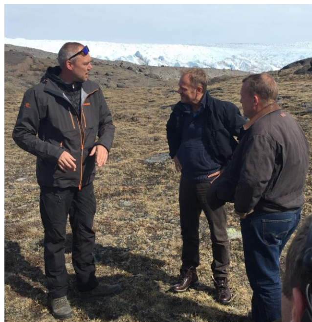
Besøg af EU-Præsident Donald Tusk 17. – 18. maj, 2016

Derudover er Arktis til stadighed på vej op på dagsordenen i EU og Bruxelles, og dette er derfor et område, som Repræsentationen skal prioritere i det daglige arbejde.