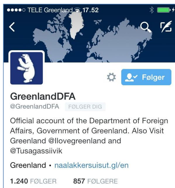
Twitter-profil for @GreenlandDFA.

Udenrigsdirektoratet har en Twitter profil @GreenlandDFA hvor public diplomacy indsatsen i første omgang udføres. Her deles budskaber og billeder enten fra aktiviteter, som Naalakkersuisut med ansvar for udenrigsanliggender, Udenrigsdirektoratet, eller i visse tilfælde andre i Selvstyret, deltager ved.