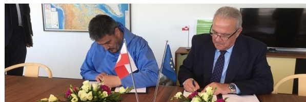
Formanden for Naalakkersuisut Kim Kielsen og Europa-Kommissær Neven Mimica mødtes og underskrev finansiell aftale for 2017 under Partnerskabsaftalen

Mødet sluttede af med underskrivelsen af dette års finansielle aftale, som muliggør fortsat udbetaling af midler fra EU til Grønland under partnerskabsaftalen.