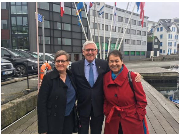
Fra højre ses Naalakkersuisoq for Sundhed og Nordisk Samarbejde Agathe Fontain, Færøernes Minister for Erhverv, Udenrigsanliggender herunder Nordisk Samarbejde Poul Michelsen og Ålands Minister for Nordisk Samarbejde Nina Fellman i Torshavn, maj 2017.

dække omkostninger ved tolkningen for medlemmer af Naalakkersuisut ved møder i Nordisk Ministerråd, samtidig med at man fra grønlandsk side selv bestemmer, hvem man ønsker som tolk. Ved denne redegørelses afslutning er sagen endnu ikke færdigbehandlet i Nordisk Råd.