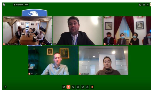
Briefing af den kinesiske ambassade i Danmark, januar 2022

I samarbejde med Grønlands Repræsentation i Beijing afholdt Repræsentationen i januar 2022 en briefing for den kinesiske ambassade i Danmark, hvor der blev givet en præsentation af samarbejdsmuligheder mellem landene. Efterfølgende har Repræsentationen i Beijing arbejdet videre på at udvikle samarbejdet mellem Grønland og Kina.