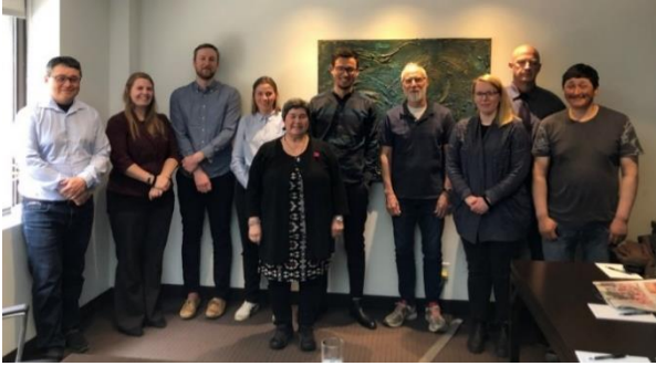
Delegationsmedlemmer i Fælleskommissionen om hvid- og narhvaler mellem Grønland og Nunavut/Canada, møde i 2019, Ottawa.