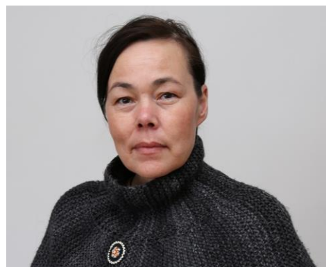
Naalakkersuisoq for Udenrigsanliggender, Erhverv og Handel

Med disse ord ser jeg frem til en givtig debat om hvordan vi i Naalakkersuisut sammen med Inatsisartut kan sikre ønsket om ”Intet om os, uden os” bliver opfyldt bedst muligt.