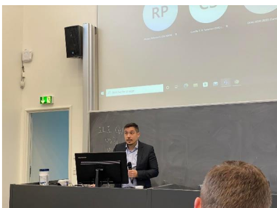
Departementchef for Udenrigsanliggender var blandt dem der gav velkomsttale til temadag på Ilisimatusarfik.

Det bemærkes, at det næste forsvarsforlig, jf. det nationale kompromis om dansk sikkerhedspolitik, vil løfte Forsvarets budget til 2% af dansk BNP inden udgangen af 2033. Analysegruppen skal i videst muligt omfang bygge videre på eksisterende analyser og rapporter, ligesom aktuelle udenlandske analyser vil kunne inddrages. Analysegruppen vil desuden skulle bidrage til at højne opmærksomheden i offentligheden på den udenrigs- og sikkerhedspolitiske situation.