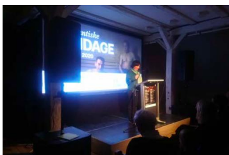
Repræsentationschefen holder tale forud for visningen af filmen "The Last Ice Hunters" ved Nordatlantiske Filmdage, marts 2020

I samarbejde med den slovenske ambassadør bidrog Repræsentation til en visning af dokumentarfilmen "The Last Ice Hunters" ved filmfestivalen Nordatlantiske filmdage i marts 2020 på Nordatlantens Brygge. Ved samme festival deltog Repræsentationen i en debat i forlængelse af dokumentarfilmen "Håbets Ø".