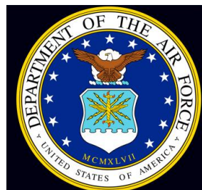
US Department of the Air Force

Repræsentationschefen har på vegne af Naalakkersuisut deltaget i møder med USA's Minister for Luftvåbenet og med USA's arktiske Koordinator i efteråret 2020. Ved møderne med Ministeren og Koordinatoren formidler Repræsentationschefen Naalakkersuisuts politik og prioriteter.