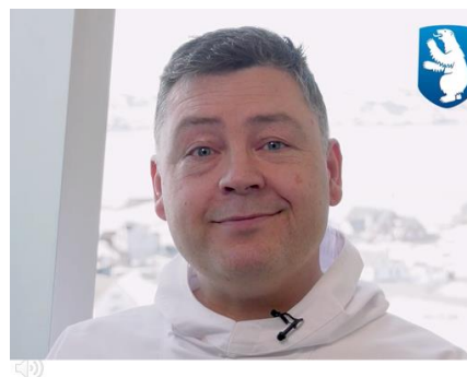
Naalakkersuisoq for Udenrigsanliggender, Erhverv, Handel og Klima, Pele Broberg, præsenterer sig selv overfor ambassadørkollegiet, maj 2021

I maj 2021 briefede Repræsentationen over 40 ambassadører om Inatsisartut-valget i april 2021. Briefingen omhandlede valgtemaerne, valgresultatet og den nye Naalakkersuisut-koalition. Naalakkersuisoq for Udenrigsanliggender, Erhverv, Handel og Klima, Pele Broberg, havde forud for briefingen sendt en videohilsen, som blev viderebragt.