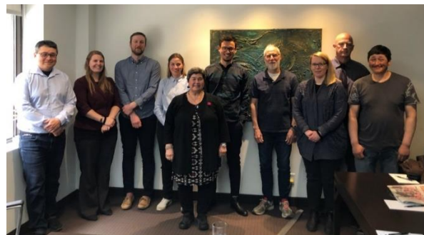
Delegationsmedlemmer i Fælleskommissionen om hvid- og narhvaler mellem Grønland og Nunavut/Canada, møde i 2019, Ottawa.

APNN havde derfor i den anledning anmodet den canadiske kommissær om at redegøre for forvaltning af fangster af narhvaler i Canada/Nunavut. Department of Fisheries and Oceans (DFO) gav under kommissionsmødet en detaljeret præsentation af deres kvotesystem og hvordan narhvaler og hvidhvaler forvaltes i Canada/Nunavut. Canadas indberetning blev en del af orienteringen til Naalakkersuisut om JCNB-mødet i 2019.