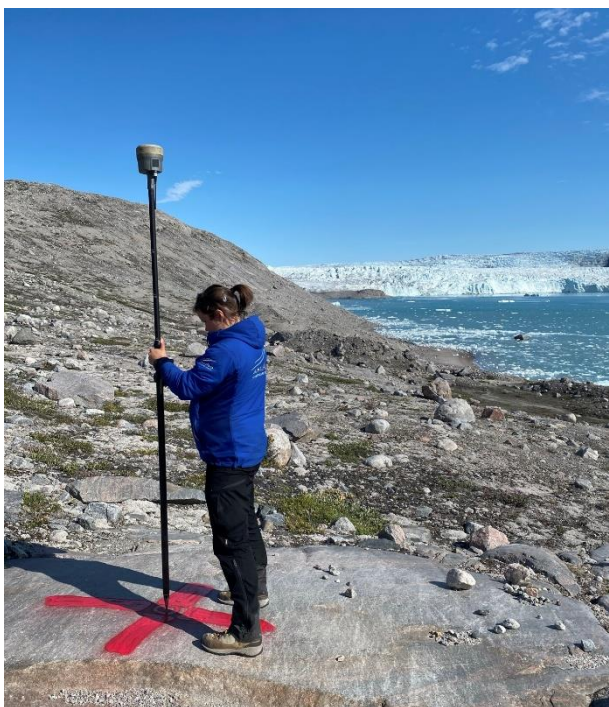
Ilulissani Sermermiuni uttortaanerit.

Sullissussusiaq taaneqartoq Asiamik 2021-imi suliaqartitsillattaalerpoq, soorlu isumagineqarluni Kinami Universiteti sullillugu Sermersuup sinaani drone atorlugu erseqqilluartunik sapaatip akunnera assiliortuineq. Asiamiillu upperineqarpoq, pilersitaq taaneqartoq taanna siunissami annertusarneqarsinnaassasoq taamallu 2022-imi kingornalu aningaasanik kaviaartitsinermut iluaqutaajumaartoq, aamma Covid-19 assigisaalu qaangiuppata.