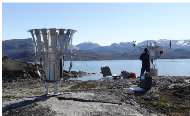
Qeqertarsuatsiaat kangiani imermik misissuut station # 493 alakkarterneqartoq.

Akiliillutik sullinneqartartut tungaannut Asiaq imermik uuttuinermik katersivinnik pingasuusunik ingerlataqarportaaq misissuissussilluni imeqarfiulersinnaasusaaqissunik.