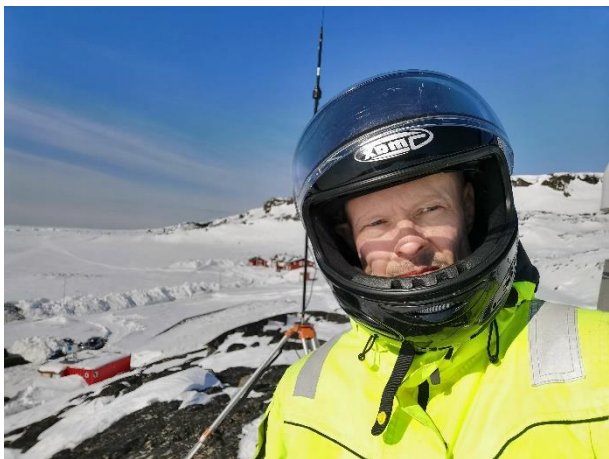
Sulami sulineq Qeqeratarsuup eqqaani GNSS-eqarfimmi.

Immikkoortortaqarfik Geodata & Kortlægning nalunaaruteqartarpoq sinnerlugu Grundkort & Referencenet (tunngaviusumik nunap assilialiornerit) , Geografisk Infrastruktur og nationale strategier (nunap iluani attavilersuinnermut tunngasut) aammalu Byggepladser & Forundersøgelser (sanaartukkanut misissueqqaarnernullu tunngasut) . Immikkoortortaqarfili Hydrologi, Klima & Miljø (HKM- imissaqarnermut, silaanaap qanoq inneranut silasiornermillu suliaqarfiusoq nalunaaruteqartarpoq sinnerlugit Hydrologiske forundersøgelser; Vejr- & klimaobservationer samt Forskning & monitoring . (imeqarnermut, silasiornermut ilisimatusarnermut uuttortaanernullu/malinnaanernut tunngasunik suliaqartut). Immikkoortorlu qeqqaniittoq Field Services (silami sulinerit) suleqatigiissutigineqarlutik ataatsimoorluni ingerlanneqarput.