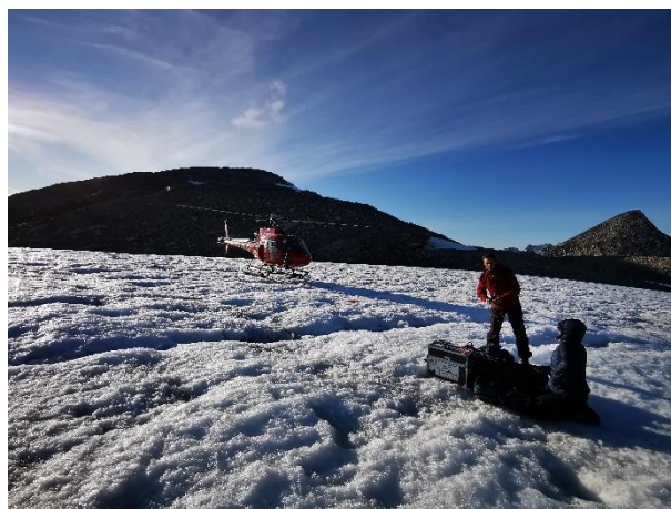
Nuummi Kangerluarsunnguami Glaciobasis-imi sermeqarfimmik malittarinninneq.

HKM ingerlanneqartumut GIOS-imut ilaavoq. Taassumalu ukiuni tulliuuttuni maarlunni aningaasalersussavai malittarinnissutit GEM-ip HKM-imut attuumassuteqartumik atortuutai.