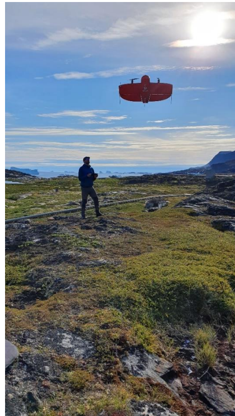
Qeqertarsuarmi qangattartittakkamik timmisitsinissamut piareersaaneq.

Taamatut inissisimaneq peqqutigalugu Asiaq nunap assilialiortui 2021 tamaat suliniarner-minni eqqornerlugaapput. Kiisalu immik-koortortaqaarfiup Geodata & Kortlægning-ip 2021-imi saniatigut GIS-imut attuumassuteqar-tunik suliaqartariaqarnera peqqutigalugu, aatsaallu 2021-imi augustusip qaammataani ilassummik sulisortaarneq peqqutigalugu, sulia-tigut Asiaq assut ajornartorsiuteqarpoq. GIS-imimi sulisussaq aatsaat inuttalerneqarmat 1. august 2021.