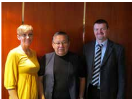
Vestnordisk Råds nytiltrådte præsidium

Igen i juni gik turen til Norge, hvor Vestnordisk Råds præsidium afholdt deres første møde i Bodø i forlængelse af deltagelsen ved Nordisk Råds præsidioms sommermøde i Bodø.