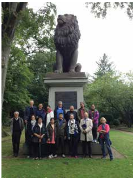
Kontaktudvalget foran Istedløven i Flensborg september 2013

Formandskabet for Inatsisartut og Folketingets præsidium afholder årligt et kontaktudvalgs-møde, der finder sted skiftevis mellem landene. I år blev mødet afholdt i Sønderjylland i dagene 1.-4. september. Kontaktudvalget udveksler parlamentariske erfaringer og drøfter emner af fælles interesser, hvor det også er tydeligt at drøftelserne på disse møder drejer sig meget om det nye Grønland, som Folketingets præsidium havde stor interesse i at blive informeret om under de politiske drøftelser mellem parterne. Næste møde er planlagt til at finde sted i Qeqertarsuaq i august 2014.