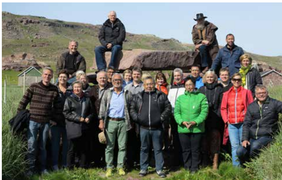
VNRs delegerationer i Igaliko under årsmødet i Narsarsuaq

Grønland varetog formandskabet i Vestnordisk Råd indtil årsmødets afslutning i august, hvor det blev overdraget til den nyvalgte delegationsformand fra Island Unnur Brá Konráðsdóttir.