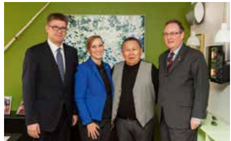
Formanden i selskab med Islands udenrigsminister, Vestnordisk Råds præsident samt Islands nye konsul i Grønland

I anledningen af Islands åbning af et konsulat i Nuuk var Islands udenrigsminister samt Vestnordisk Råds præsident på besøg hos formanden for Inatsisartut i november. Åbningen af Islands konsulat er ligeledes resultatet af en rekommandation fra Vestnordisk Råd.