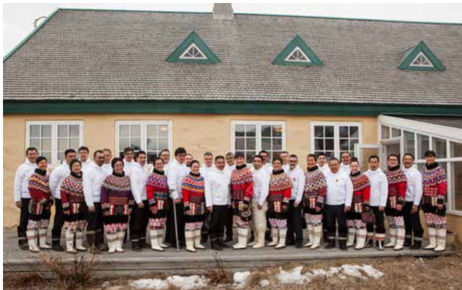
Konstituering den 5. april

Der blev til den konstituerende samling i april dannet en koalition bestående af S, A og PI med 8 medlemmer i Naalakkersuisut. Hvoraf 3 medlemmer af Naalakkersuisut ikke er valgt til Inatsisartut og 4 medlemmer har taget orlov fra Inatsisartut. Det betyder, at der er indtrådt 4 medlemmer i Inatsisartut for de medlemmer af Naalakkersuisut som har taget orlov.